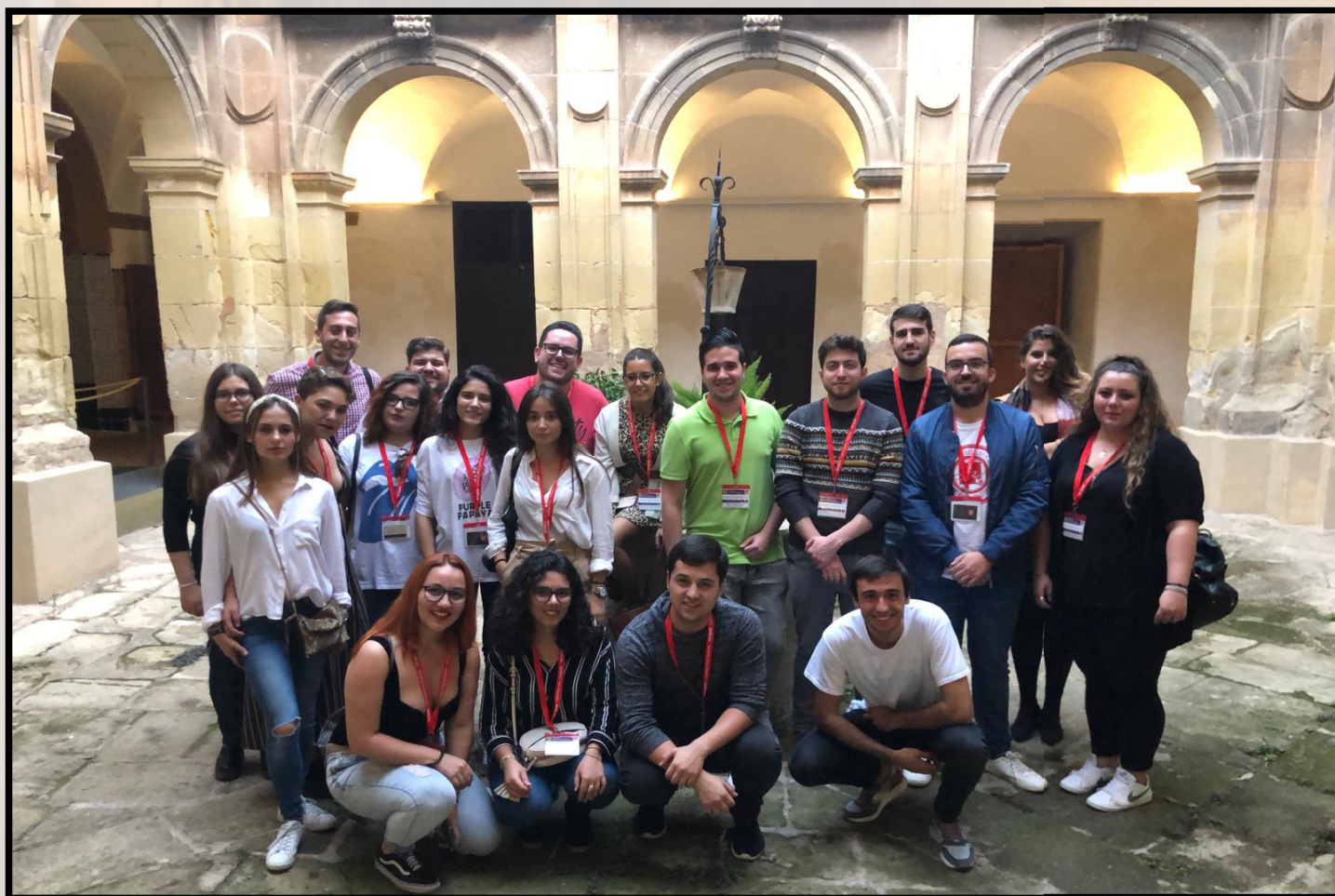
Congresistas de las Universidades Españolas en la visita a los baños árabes de Elche

Por último, las compañeras del Comité, volvieron a acompañar a los congresistas al hotel, donde se celebró la primera cena de este LVII Congreso AERELABO y unas dinámicas de presentación. Dando fin de esta forma al día previo del acto de apertura del congreso.