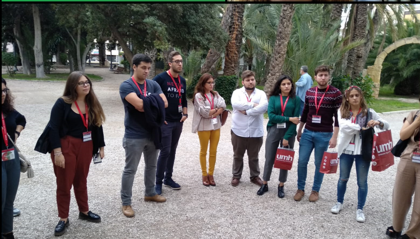
Congresistas de otras universidades en El Palmeral de Elche