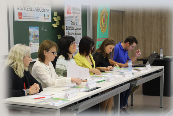
Mesa del acto de clausura