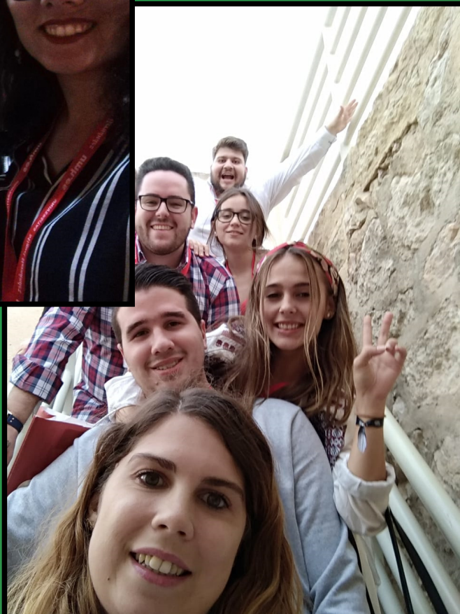
Congresistas de las Universidades Españolas en el Palacio de Altamira