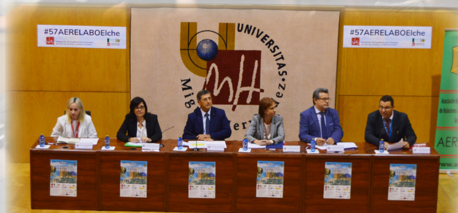
Mesa de inauguración del LVII Congreso AERELABO

Esta primera jornada contó con la presencia de casi cuatrocientas personas; ya que se abrió para todos los curiosos que quisiesen acudir, al contrario que el resto de días de Congreso.