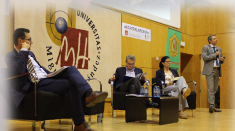
Mesa redonda “Eliminando barreras a las personas con diversidad funcional”

“Nos dejamos llevar por una idea de limitaciones que luego no existen”