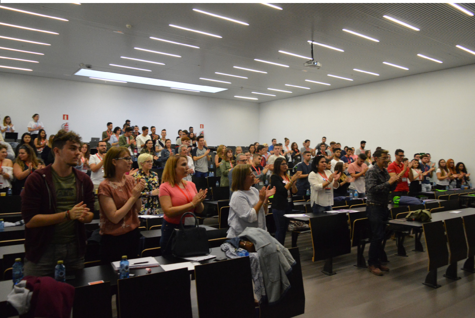
Aplauso de todos los asistentes en recuerdo de las víctimas de violencia de género de este año

Desde su experiencia, la ponente, en definitiva quiso transmitirnos que estamos en un mundo en el que se discrimina a las mujeres y a los discapacitados. Tenemos que romper estas barreras desde las RRLL y los RRHH.