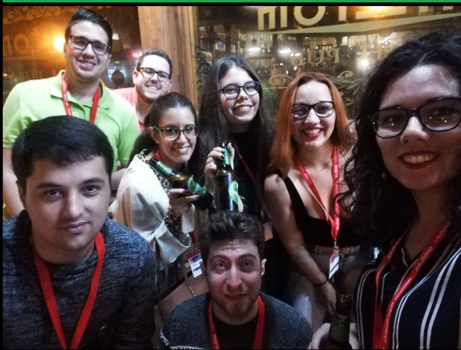
Congresistas tomándose un descanso después de La visita por Elche